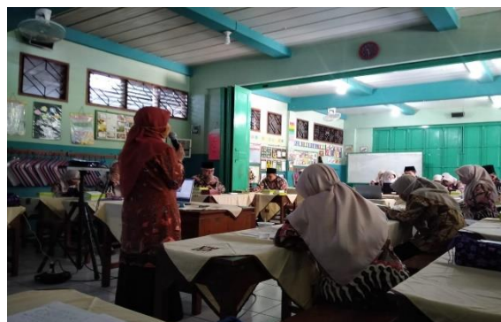
Gambar 2. Narasumber 1 menyampaikan materi

active presenter, mentimeter dan answer garden. Guru terlihat antusias dalam mengikuti pelatihan ini.