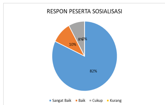
Gambar 6. Grafik hasil respon peserta sosialisasi

Setelah sosialisasi juga dibagikan kuesioer terkait dengan bagaimana respon peserta sosialisasi, dan diperoleh hasil sesuai grafik berikut.