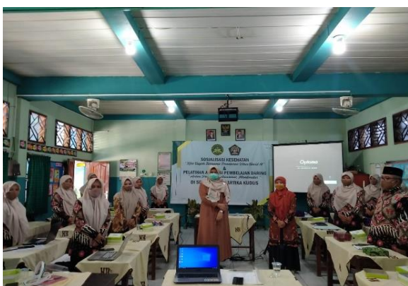
Gambar 4. Foto bersama dengan peserta pelatihan

Pelatihan dihadiri sekitar 35 peserta. Dari hasil survei kepuasan diperoleh data 85% sekitar 27 peserta menyatakan sangat puas terhadap kegiatan pengabdian. Dan diperoleh 10% sekitar 3 peserta didik menyatakan puas serta 5 % menyatakan cukup puas. Adapun terkait saran dari peserta, mereka berharap kegiatan ini ada tindak lanjut baik berupa pendampingan atau pelatihan aplikasi pembelajaran lainnya.