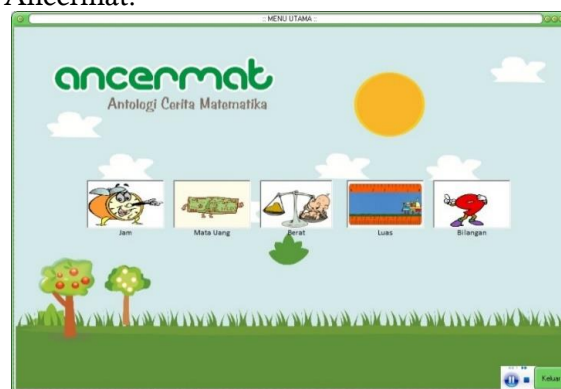
Gambar 8. Tampilan depan Ancermat

Cara mengoperasikan aplikasi Ancermat sangatlah mudah, saat pelatihan peserta menginstall aplikasi tersebut, dan bisa digunakan untuk berbagai macam jenis laptop. Berikut tampilan depan aplikasi Ancermat.