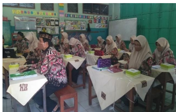
Gambar 1. Kegiatan Sosialisasi Pengabdian

disampaikan jika akan ada kegiatan pengabdian dari Dosen FKIP Unissula yang akan dilaksanakan pada tanggal 28 September 2020. Pada kegiatan sosialisasi juga diberikan kesempatan Tanya jawab dari guru-guru atau peserta sosialisasi lainnya. Adapun saran yang disampaikan terkait pelaksanaan pelatihan adalah adanya materi terkait Covid, hal ini sama dengan masukan dari Bapak Kepala Sekolah. Selain itu, guru juga menyarankan jika alangkah lebih baik jika ada pelatihan terkait dengan aplikasi pembelajaran lainnya untuk membantu pembelajaran daring yang saat ini sedang berjalan. Dari masukan tersebut tim pengabdian menjadikannya sebagai bahan pertimbangan dalam pelaksanaan pelatihan nantinya. Dari sosialisasi ini terlihat antusiasme guru-guru sangat tinggi, respon mereka sangat baik dan penuh harap dari pelatihan dan kegiatan pengabdian ini. Dari Tim pengabdian sangat berharap nantinya kegiatan pelatihan dapat berjalan dengan lancar dan dapat mengakomodir masukan saran dari peserta pengabdian.