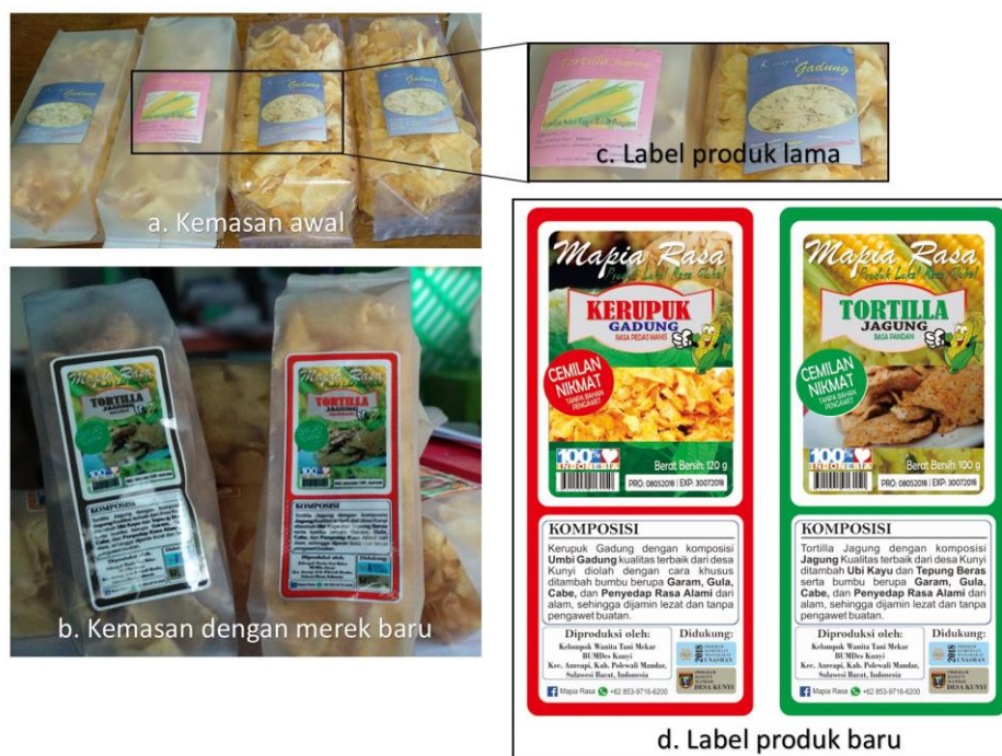
Gambar 2: Perbandingan label dan merek produk

Selanjutnya untuk mengukur kualitas perubahan kemasan dan label serta penambahan merek produk sebagaimana pendekatan yang dilakukan, maka digunakan kuesioner dalam bentuk formulir offline dan online dengan berpedoman pada lima indikator pada Tabel 1. Dari 28 Responden yang mencoba produk dari rentang tanggal 10 hingga 14 Mei 2018. Hasil analisa menunjukkan bahwa: