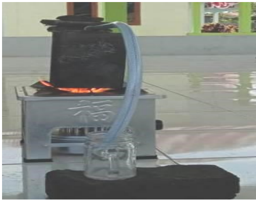
Gambar 4. Uji coba protipe alat pengolah limbah plastik.

Penilaian partisipan terhadap prototipe alat direkam pada catatan di bawah ini.