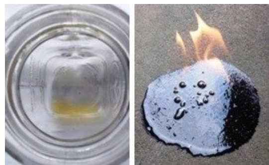
Gambar 6. Luarannya pengolahan limbah plastik.

Mangacu dari uraian point 1, 2 dalam hasil dan pembahasan, maka fokus pertanyaan pada pendahuluan telah tercapai. Khusus untuk prototipe pengolah limbah plastik memiliki beberapa kekurangan, seperti keluarnya gas dari wadah penampung akhir, dan menyisakan banyaknya residu (material plastik) dalam wadah penampung. Menurut Mohd. Wasif Quadri & Devendra Dohare, (2020), residu tersebut karena pembakaran tidak mencapai suhu 500 °C. Walaupun terdapat kekurangan pada prototipe tersebut, tapi tetap menghasilkan luaran BBM gambar 6.