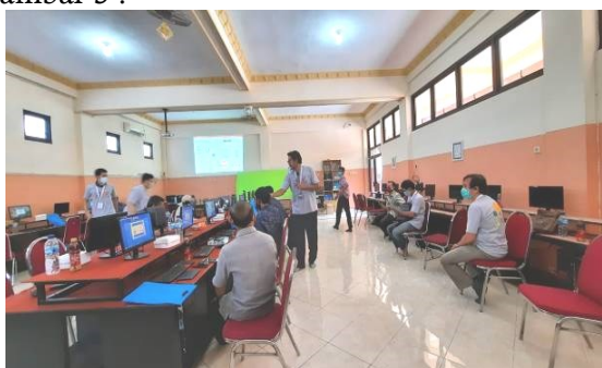
Gambar 3. Suasana di ruang pelatihan

Pada kegiatan pelatihan untuk guru diadakan dalam dua sesi. Pada sesi pertama, guru-guru diberikan penjelasan mengenai strategi mengajar yang interaktif menggunakan aplikasi Zoom dan Quizizz , seperti yang ditunjukkan pada gambar 2, Sedangkan pada sesi kedua, para guru mendapat penjelasan teknis penggunaan perangkat mengajar seperti ditunjukkan pada gambar 3 .