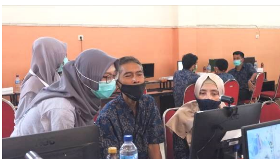
Gambar 5 : Pendampingan peserta saat tutorial penggunaan pen tablet dan webcam