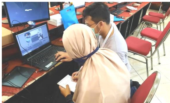
Gambar 4 : Pendampingan peserta saat materi OBS

Pada akhir pelatihan, kuisisioner diberikan kepada peserta pelatihan untuk