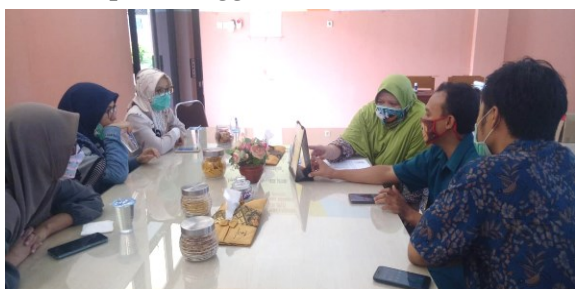
Gambar 1 : Diskusi dengan pihak sekolah

Diskusi dengan pihak sekolah dilakukan agar dapat mengetahui permasalahan yang tengah dihadapi oleh para guru di masa pandemi saat ini. Blended learning dapat meningkatkan kualitas belajar dan pemahaman terhadap materi (Obiedat et al., 2014). Menurut para guru, di situasi pandemi saat ini, siswa di SMK Islam Al Amal tidak dapat optimal memahami materi pelajaran bila hanya dilakukan pembelajaran daring saja. Agar dapat menerapkan blended learning , guru harus memiliki pemahaman lebih terkait penggunaan koneksi internet, cara menyediakan bahan ajar secara digital yang efektif, dan strategi mengajar secara interaktif. Pada gambar 1 merupakan dokumentasi saat berdiskusi dengan pihak sekolah pada tanggal 27 Oktober 2020.