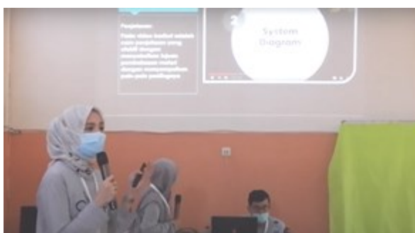
Gambar 2 : Penyampaian materi pada sesi pertama

Pada kegiatan pelatihan untuk guru diadakan dalam dua sesi. Pada sesi pertama, guru-guru diberikan penjelasan mengenai strategi mengajar yang interaktif menggunakan aplikasi Zoom dan Quizizz , seperti yang ditunjukkan pada gambar 2, Sedangkan pada sesi kedua, para guru mendapat penjelasan teknis penggunaan perangkat mengajar seperti ditunjukkan pada gambar 3 .