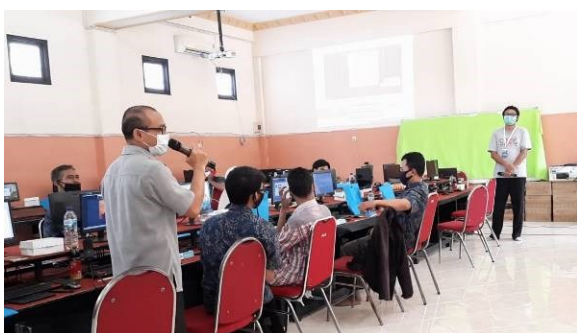
Gambar 6 : Diskusi dan tanya jawab dengan peserta

mengetahui respon peserta terhadap pelatihan yang telah dilakukan. Dari sejumlah guru yang telah memberikan respon, 77.8% mengalami kendala dalam menyampaikan materi pelajaran pada masa pandemi, seperti ditunjukkan pada grafik 1. Hal tersebut tidak lepas dari berkurangnya waktu tatap muka di kelas, sehingga capaian pembelajaran pun tidak optimal. Pada grafik 2 menunjukkan semua peserta merasakan manfaat dari pelatihan yang telah diberikan mengenai penggunaan perangkat dan media dalam mengajar secara daring. Hal tersebut