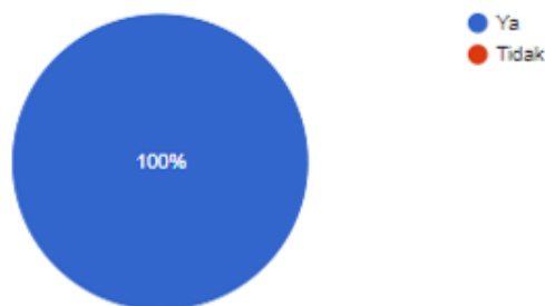
Grafik 2 : Semua peserta menilai pelatihan yang diadakan telah menambah wawasan teknologi