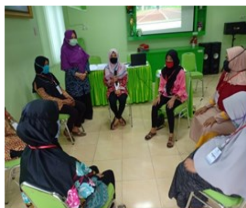
Gambar 3. Kader kelompok 3 mendemonstrasikan afirmasi positif