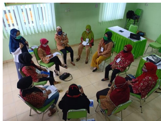
Gambar 2. Kader kesehatan kelompok 2 mendemonstrasikan melakukan afirmasi positif