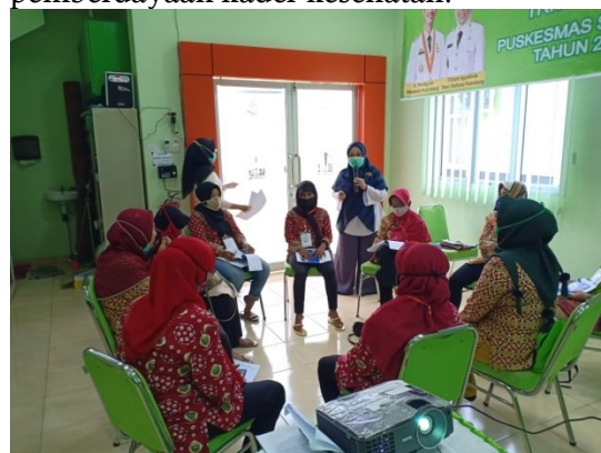
Gambar 1. Kader kesehatan kelompok 1 mendemonstrasikan afirmasi positif

Berikut foto pelaksanaan pemberdayaan kader kesehatan: