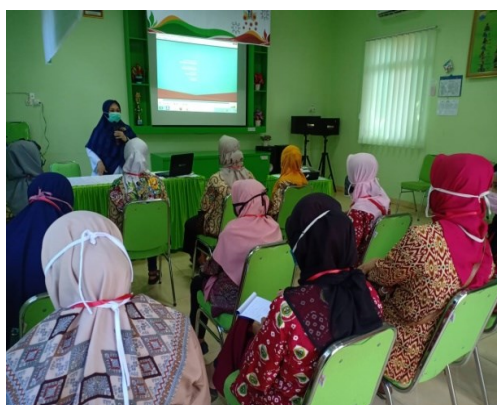
Gambar 4. Penyajian materi afirmasi positif oleh narasumber kepada kader kesehatan

Hasil pendampingan memberikan hasil bahwa seluruh kader mampu memberikan penjelasan dan mencontohkan kepada masyarakat. Setelah kader kesehatan mencontohkan, selanjutnya nampak bahwa warga mampu mendemonstrasikan kembali dihadapan kader dan fasilitator.